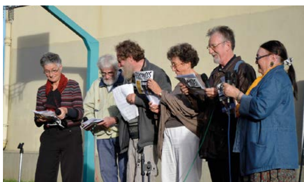
↑ Avec l'atelier contes d'ATDQM le 17 octobre 2013, Journée internationale du refus de la misère.

Ce qui la fascine avec les contes, c'est « la parole symbolique » grâce à laquelle on peut tout dire sans pour autant devoir se dévoiler, « parce qu'on passe par l'imaginaire, l'irrationnel ». Elle cite les mots de cette militante d'ATD Quart Monde interrogée par la Revue Quart Monde : « Vous m'avez demandé mon avis. C'est comme si on m'avait donné le ciel ! ». « Sans le savoir, explique Gigi, elle a utilisé la parole symbolique. Et elle a beaucoup mieux exprimé sa pensée qu'en disant : « Je me sens