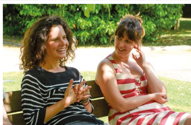
↑ Lors de la session de découverte du volontariat du 25 au 27 mai 2018 à Méry-sur-Oise et à Pierrelaye (Val-d'Oise).

V olontaires permanents, alliés diffusant dans leur milieu le combat contre la pauvreté, militants Quart Monde ayant connu ou connaissant la précarité, stagiaires en service civique, professionnels en mécénat de compétences, salariés, bénévoles... ATD Quart Monde repose sur l'engagement de personnes très diverses, rassemblées autour de celles qui sont confrontées à la grande pauvreté, le point de départ et le cœur de son action.