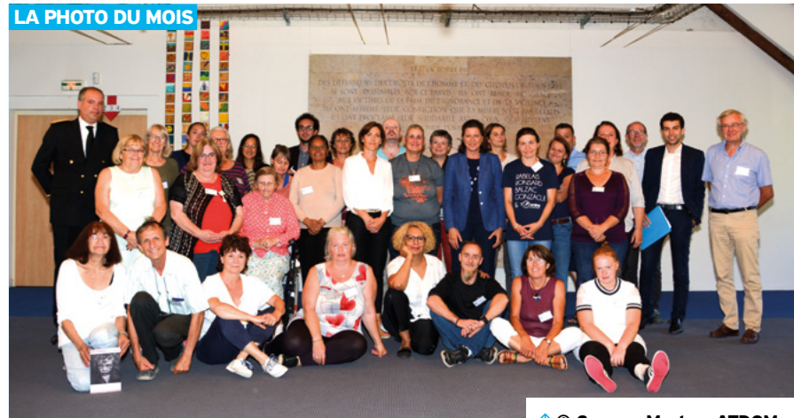
↑ © Carmen Martos, ATDQM