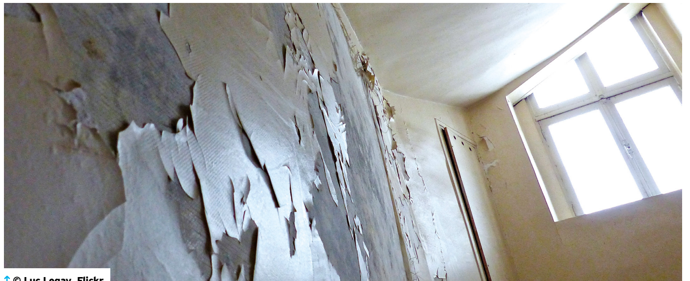
↑ © Luc Legay, Flickr

Retrouvez sur le site internet d'ATD Quart Monde les études et rapports du Laboratoire d'idées Santé d'ATD Quart Monde dont « Qualité de l'air intérieur : mais que respire-t-on dans les logements insalubres ? », « Contribution à l'analyse de l'impact de la pandémie Covid-19 sur la santé des personnes en grande pauvreté » (2020), « Prendre sa retraite quand on est pauvre » (2020) ou encore « Santé, prison, grande pauvreté : une triple peine » (2019).