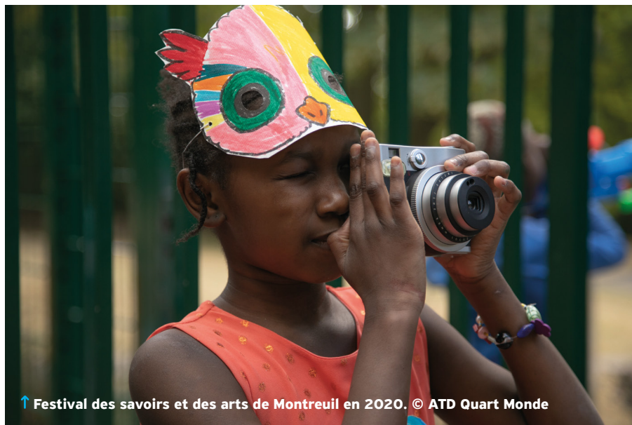
↑ Festival des savoirs et des arts de Montreuil en 2020.

↑ Chantier jeunes à Baillet, mai 2022.