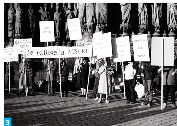
↑ Trente photos prises partout dans le monde le 17 octobre ont été exposées au Conseil économique, social et environnemental, puis au Trocadéro le 9 juin. 1- Manille, Philippines, 1994. © ATD Quart Monde. 2- Rennes, 1998. © ATD Quart Monde. 3 - Reims, 2000. © ATD Quart Monde.