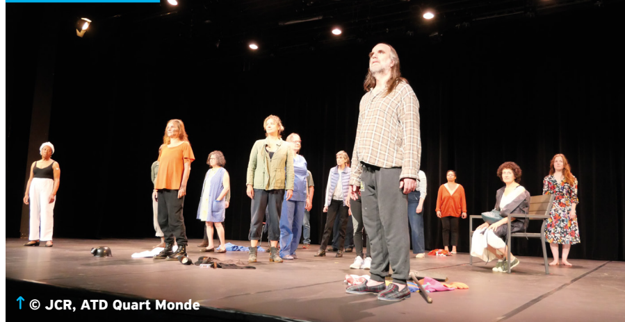
↑ © JCR, ATD Quart Monde