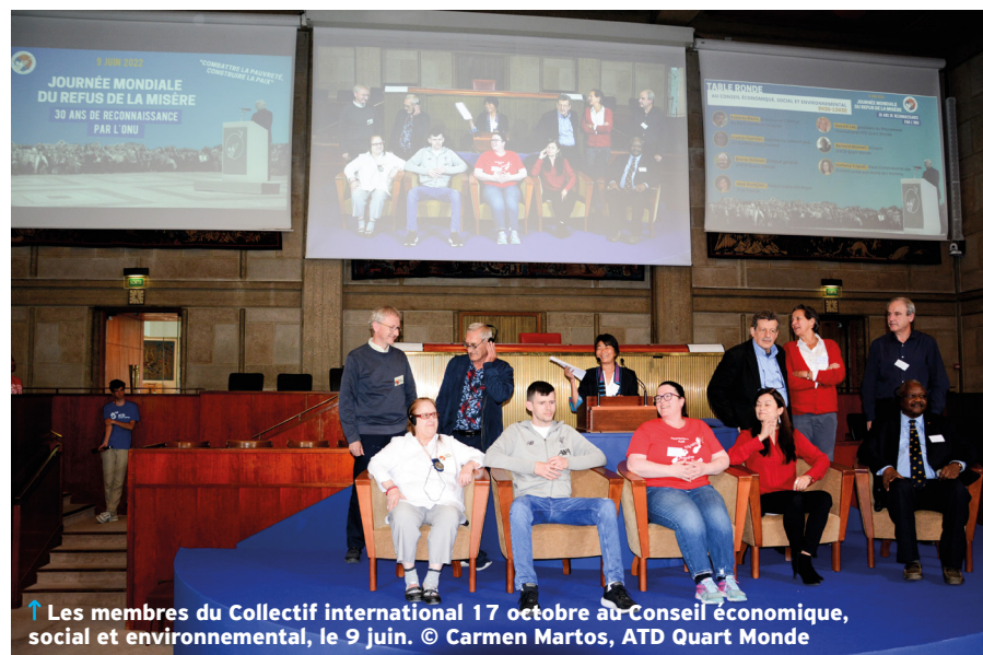
↑ Les membres du Collectif international 17 octobre au Conseil économique, social et environnemental, le 9 juin.