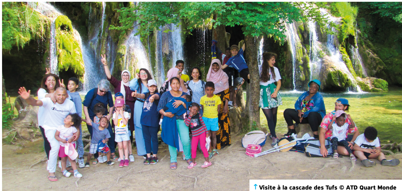
↑ Visite à la cascade des Tufs